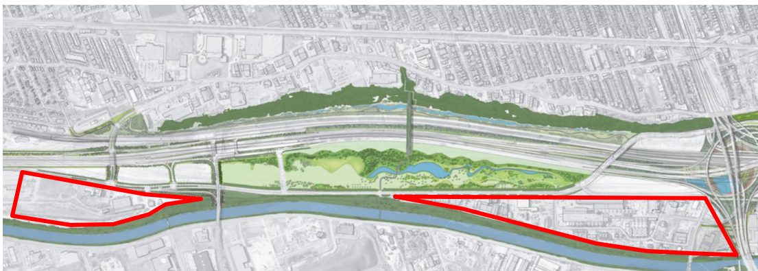
Figure 1. Emplacement des secteurs industriels compris dans l'écoterritoire de la Falaise St-Jacques

L'écoterritoire de la Falaise St-Jacques comprend deux secteurs à vocation industrielle (voir figure 1). La création du nouveau parc de la Cour Turcot, l'achalandage qu'il générera et le réseau de mobilité durable qu'il contribuera à consolider, commandent selon nous une requalification de ces deux secteurs industriels, inspirée du concept d'« éco-parc industriel ».